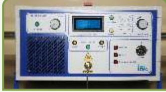
Laser DCR नेत्रनली की सर्जरी