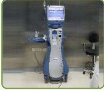
Phacoemulsification मोतियाबिंद सर्जरी