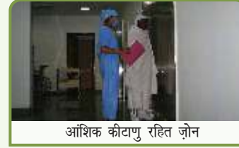
आंशिक कीटाणु रहित जोन

इस जोन में मरीजों को ओटी के लिए बनाये गये स्टरलाइज्ड कपड़े पहनाकर प्रवेश कराया जाता है।