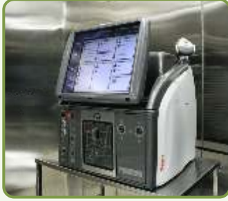
Automated Vitrector रेतीना की सर्जरी