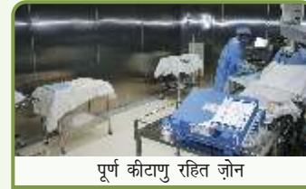
पूर्ण कीटाणु रहित जोन

यह जोन पूर्णतः संक्रमणरोधी होता है। इसमें ऑपरेशन की प्रक्रिया की जाती है।